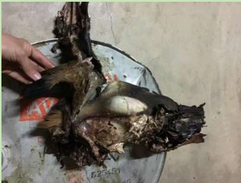
Figure 4: Skull with ossicones not fused yet.

Il a été surprenant de ne pas trouver plus girafe tue, mais il est probable qu'ils se produisent dans des zones inaccessibles ou tout simplement invisible pour nous, le personnel du parc et gardes forestiers, mais nous continuons à garder un œil sur.