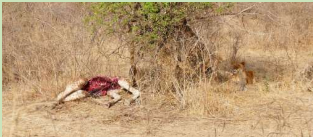
Figure 3: Second giraffe carcass with lioness.

Le 6 Février, nous avons rencontré une mort fraîche tôt un matin dans le parc (voir la figure 3) au sud du camp Tinga, où une lionne et ses trois oursons ont été au repos après avoir tué et mangé les organes internes d'une girafe sous-adulte, que je vieux vieilli à 3,5-4 ans.