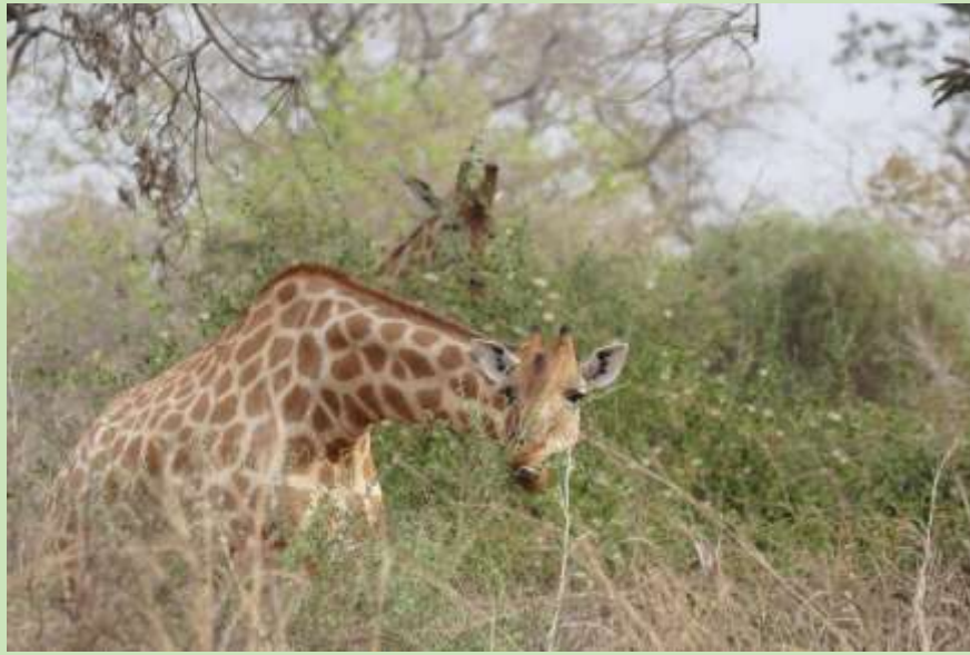
Figure 7: Giraffe browsing