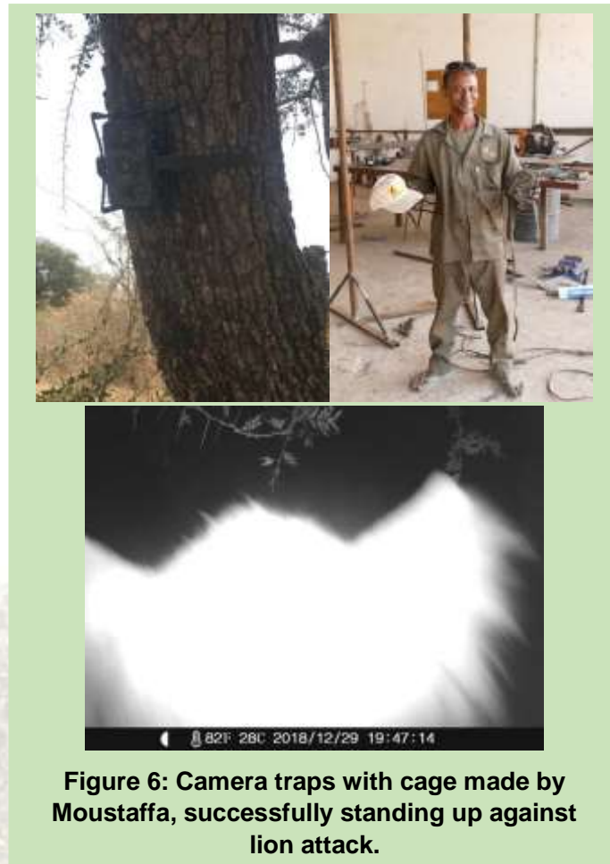
Figure 6: Camera traps with cage made by Moustaffa, successfully standing up against lion attack.