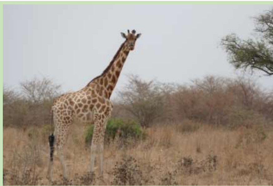
Figure 5: ZAK 6 with Ossiunit on left ossicone, approx. A six weeks after unit attached.

Six des huit girafe femelle Ossiunits attaché avait été repéré dans la seconde moitié de la saison; tous à la recherche en santé, avec leurs compagnons respectifs et ne montrant aucun des problèmes de comportement anormal. Aucun n'a été prévu, avec cet appareil bien développé et testé précédemment, mais il est toujours bon d'avoir la tranquillité d'esprit de voir avec vos propres yeux. Aucun ont déménagé très loin de là où ils étaient « munis d'un collier », bien que je pense que cela change que la saison des pluies arrive, et ils continueront à surveiller numériquement de ma base au Royaume-Uni. La figure 5 montre ZAK 6 avec son Ossiunit.