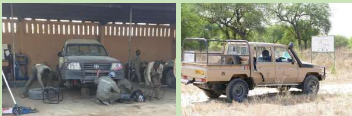
Figure 8: Survey vehicle and suitable Land Cruiser vehicle sought for next three seasons.

Dans le cas où le financement est disponible pour cette gestion Zakouma ont gentiment offert le même contrat de location pour la durée du projet pour leur voiture de garde ex. La figure 8 montre le véhicule de l'enquête et le véhicule Toyota Land Cruiser qui serait idéal pour les prochaines saisons de l'enquête.